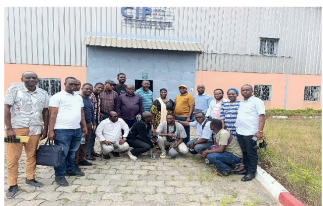
Incubateur de la Chambre de Commerce et incubateur Public du ministère des PME