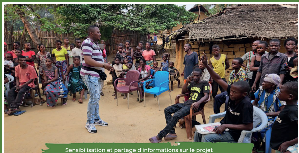
Sensibilisation et partage d'informations sur le projet AVENIR avec les peuples autochtones pygmées dans les secteurs du territoire d'Oshwe, province de Mai-Ndombe

En plus d'autres séances de sensibilisation et d'information ont été organisées avec une note satisfaisante dans les secteurs du territoire de Oshwe avec les populations des peuples autochtones pygmées.