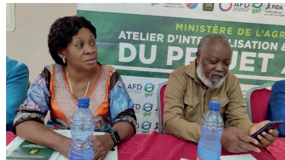
Participation des membres du COPIL à l'atelier d'internalisation à Kenge en février 2024.

Ensuite, l'atelier de lancement a ainsi pu être organisé qui a été suivi en février 2024 par un atelier d'internalisation durant lequel les consultants clés ayant contribué à la formulation du DCP ont pu coacher la nouvelle équipe de l'UGP afin qu'elle puisse s'approprier l'approche et le contenu du projet. Cet atelier d'internalisation a été organisé dans les quatre zones ciblées du projet. A savoir respectivement ; Mbanza Ngungu, Kenge, Kikwit et Inongo.