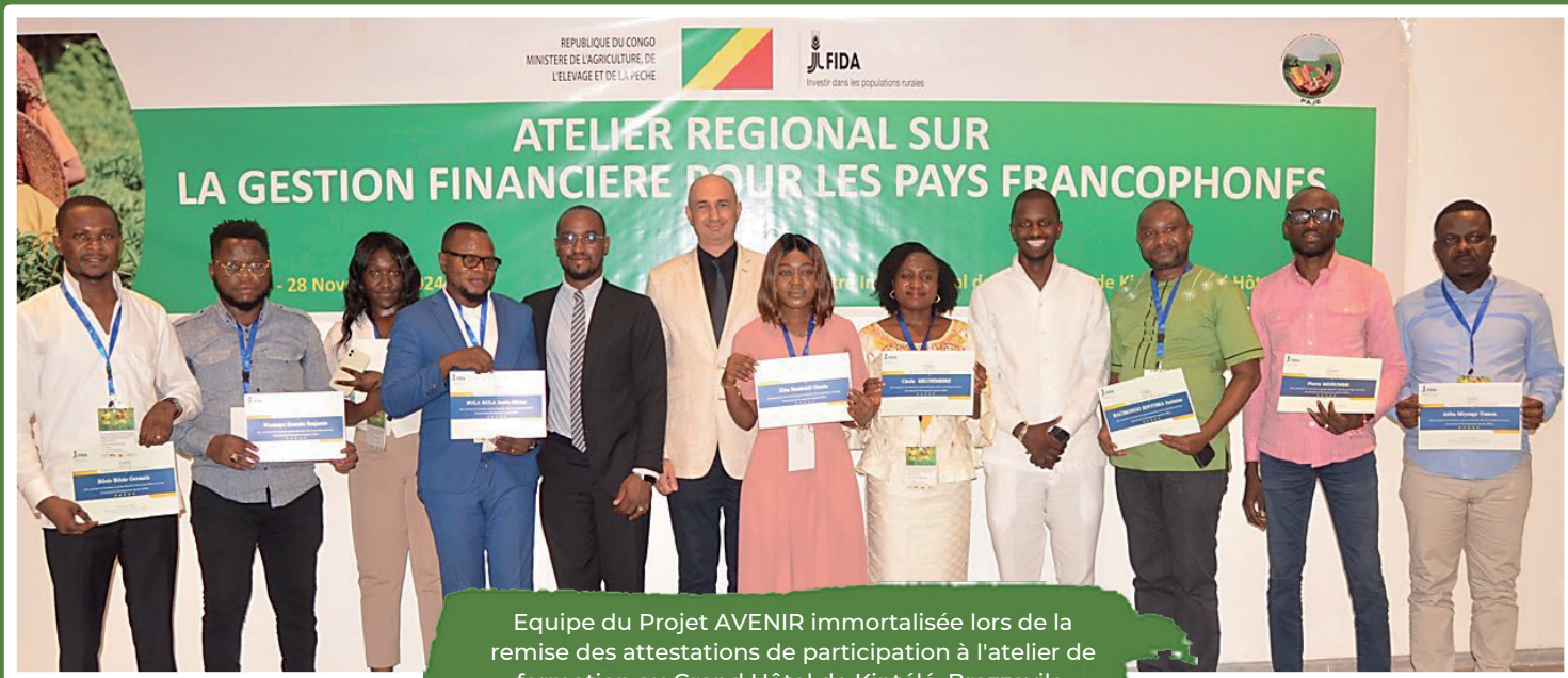
Equipe du Projet AVENIR immortalisée lors de la remise des attestations de participation à l'atelier de formation au Grand Hôtel de Kintélé, Brazzaville.